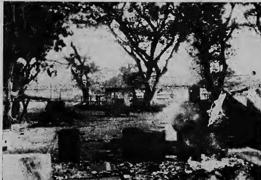
E BRINGAMENTO NA LAOS — Aki ta un aspecta di Laos, capital di Vientiane, na unda tabatin un bombardeo durante bringamentonan reciente. Esaki ta lake a resta di un deposito militar, un monton di carbon.

LONDEN, 17 januari. — Dr. Geoffrey Fisher, arzobispo di Canterbury y lider espiritual di iglesia anglicano, a anuncia na Londen, cu e ta retira dia 31 Mei. Oficina di prime ministro MacMillan a informa cu reina Elizabeth lo nombra dr. Fisher den noblez, lo ta pa keda eune te dia e muri. Na e manera aki dr. Fisher lo por keda miembro di Camara de los Lores, di cual e ta miembro awor pa motibu di su puesto. Circulonan bon informa ta bisa cu e sucesor dje arzobispo di Canterbury ta hanja un salario di mas cu NA f 37.500 pa anja.